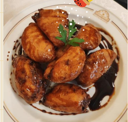
Баклажаны с медом