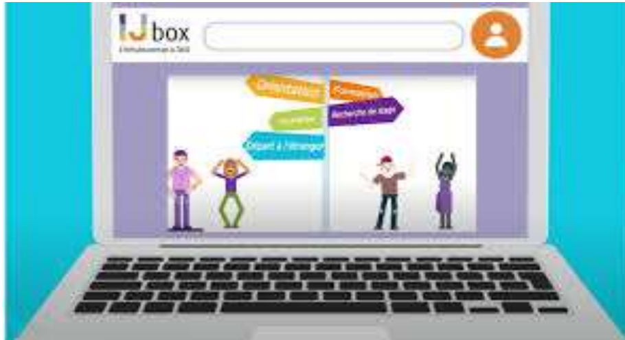
IJBox via E-sidoc sur Néo